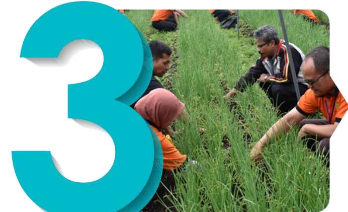
Pelatihan sejuta petani dan penyuluh pertanian