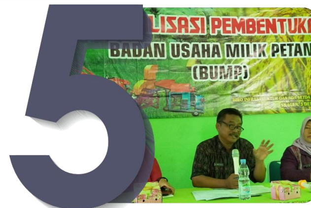
Penguatan Kelembagaan Ekonomi Petani (KEP);