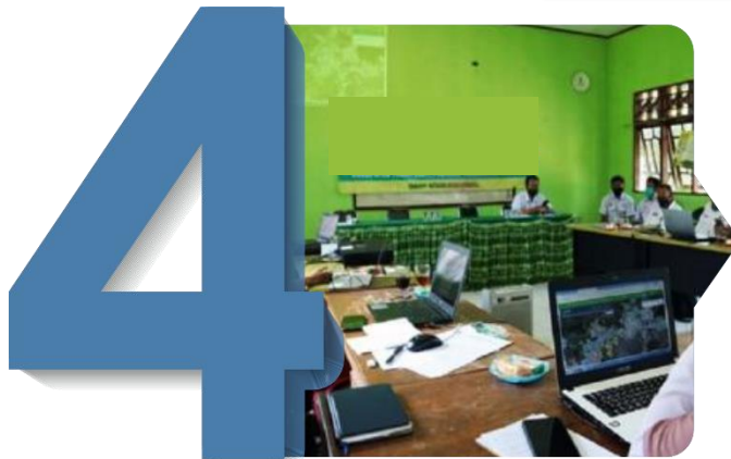
Penguatan Peran BPP dan Koneksinya dengan AWR