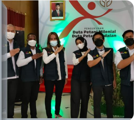
Pemberdayaan 2,5 Juta Petani Milenial