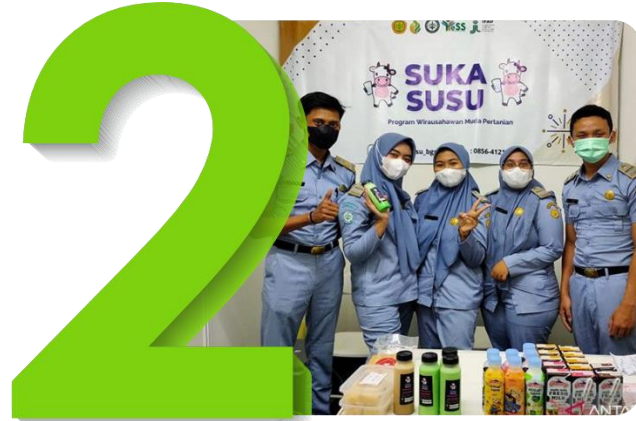
Pengembangan Wirausaha Muda (Young Entrepreneur) Pertanian;